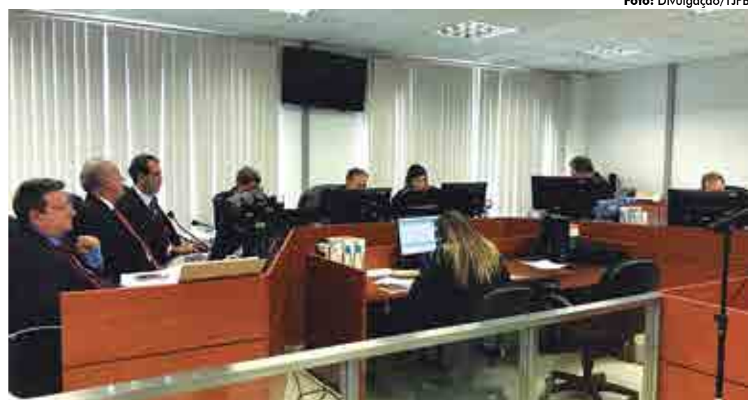
A decisão foi da Segunda Câmara Cível do Tribunal de Justiça da Paraíba, por unanimidade e em harmonia com o parecer do MP

Alegou, ainda, que os contratados exerceram serviços relevantes, sempre visando o interesse público e a premente necessidade da