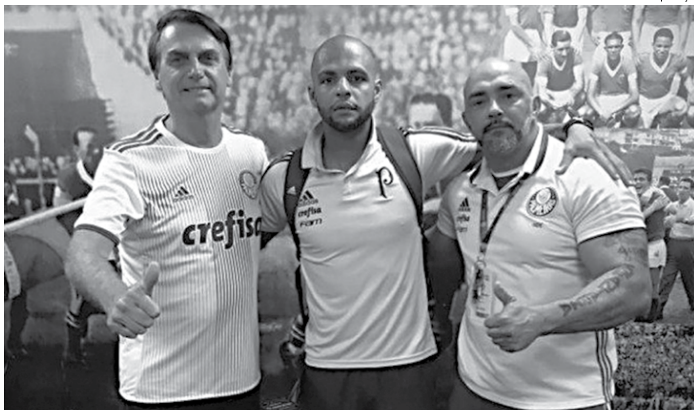
Jair Bolsonaro ao lado do meia Felipe Melo. Torcedor do clube, o presidente eleito aceitou o convite da diretoria do Alverde paulista