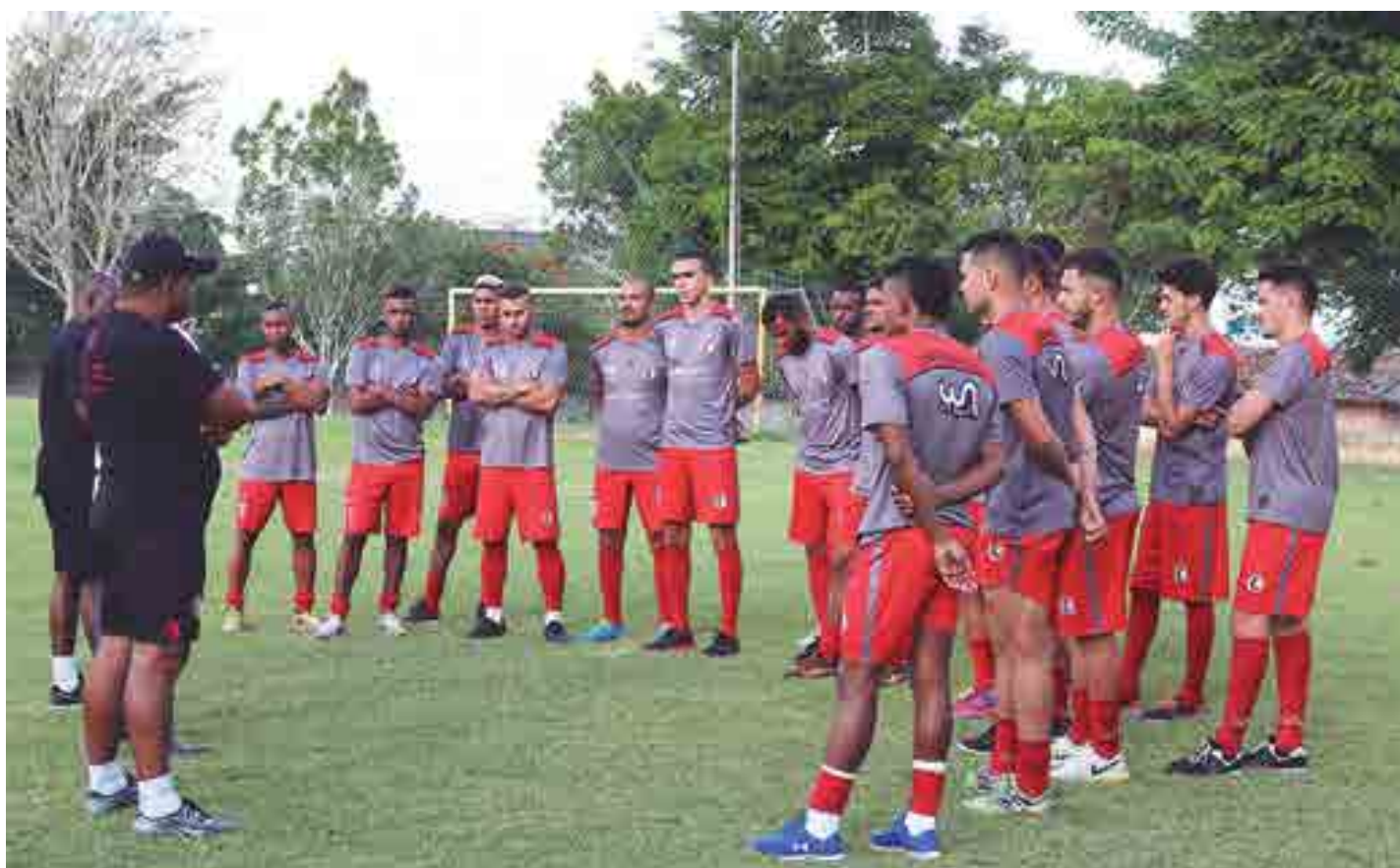
Enquanto os jogadores do Galo estão chegando, os da Raposa já estão participando dos treinamentos no Colégio Marista, na cidade de Lagoa Seca