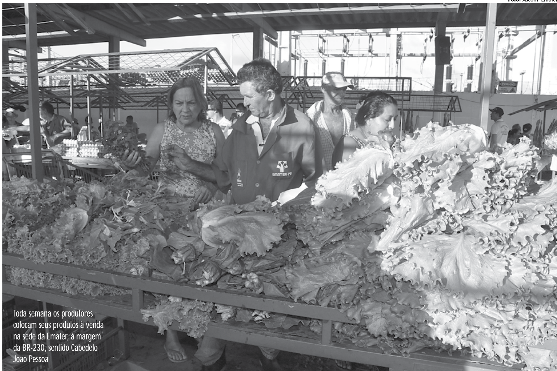
Toda semana os produtores colocam seus produtos à venda na sede da Emater, à margem da BR-230, sentido Cabedelo João Pessoa

Ele ainda explicou que a finalidade da criação das feiras é incentivar e garantir a integração do agricultor na cadeia produtiva e, com isso, permitir a oportunidade de trabalho, renda e de qualidade de vida para as famílias rurais. Das 15 regionais administrativas da Emater, 13 já foram dotadas de feiras destinadas à