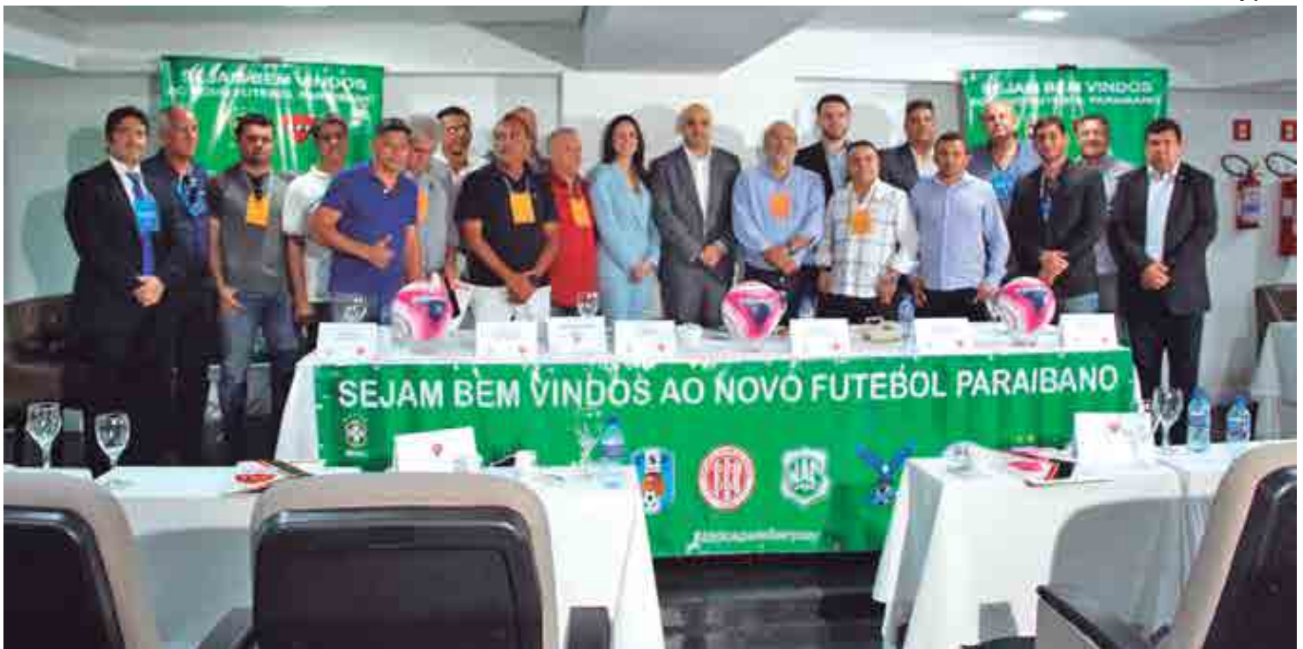
Reunião do Conselho Arbitral num hotel da capital que definiu o regulamento do Campeonato Paraibano de 2019 e o seu regulamento que prevê pagamento antecipado nos jogos pelos clubes

O artigo 14 do regulamento da competição diz o seguinte: "os pagamentos