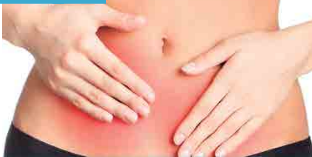
Hospital Universitário Lauro Wanderley, em João Pessoa, fará os procedimentos cirúrgicos nos dias 6, 7 e 8