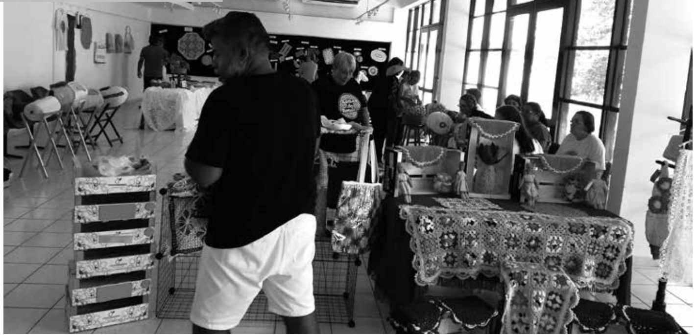
A exposição de trabalhos artísticos e apresentações culturais marcaram o I Encontro de Rendeiras de Bilros da Paraíba, na Fundação Casa de José Américo