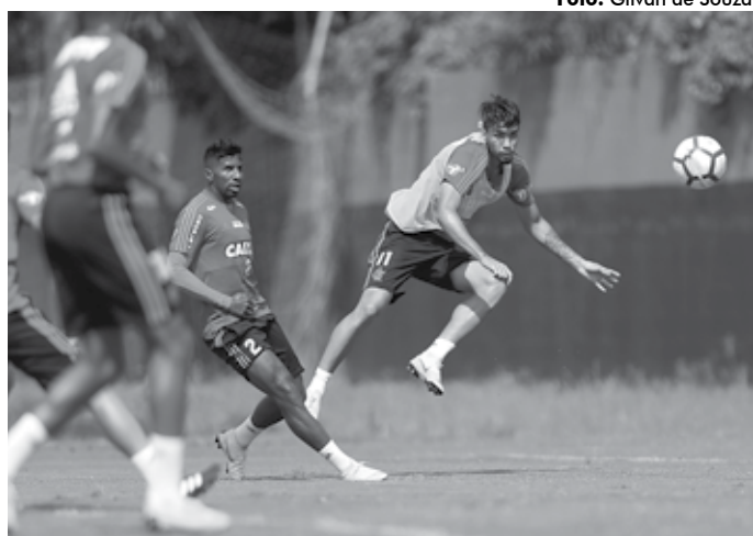
Paquetá vai fazer o seu último jogo pelo Flamengo neste sábado