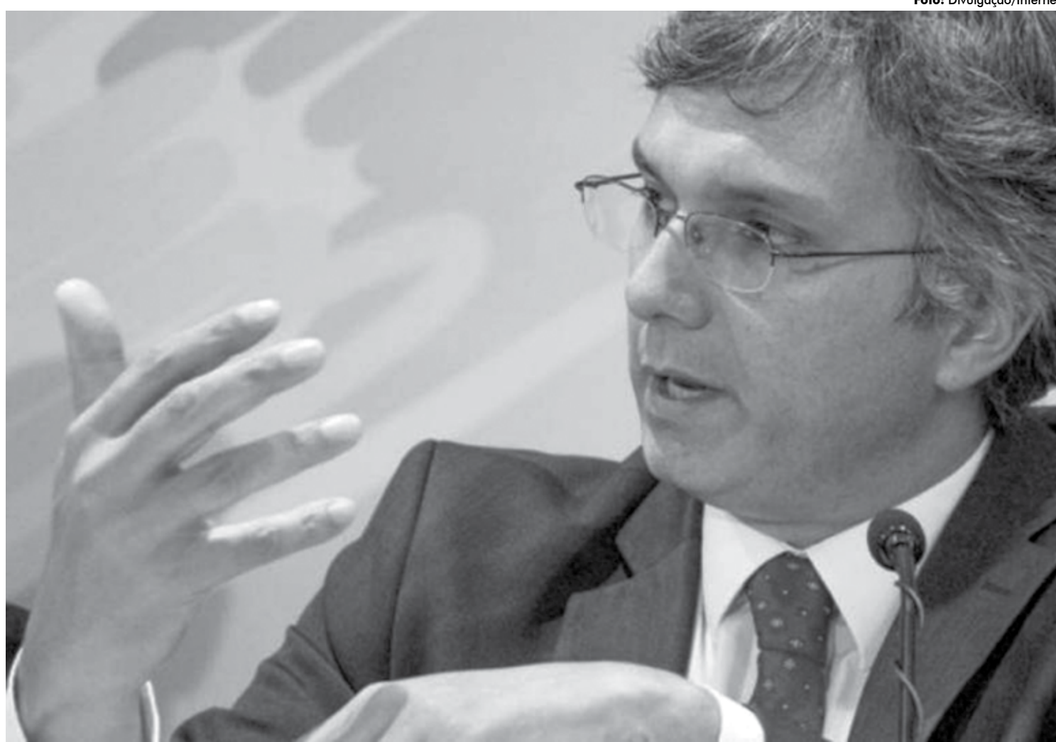
Esteves Colnago, ministro do Planejamento, classificou a ferramenta como um "mercado livre" do governo. A medida vai agilizar vários processos administrativos

R$ 108 bi em estoque Segundo Colnago, a União tem um estoque de 108 bilhões em bens móveis e, com esse sistema simples, a localização, transferência e