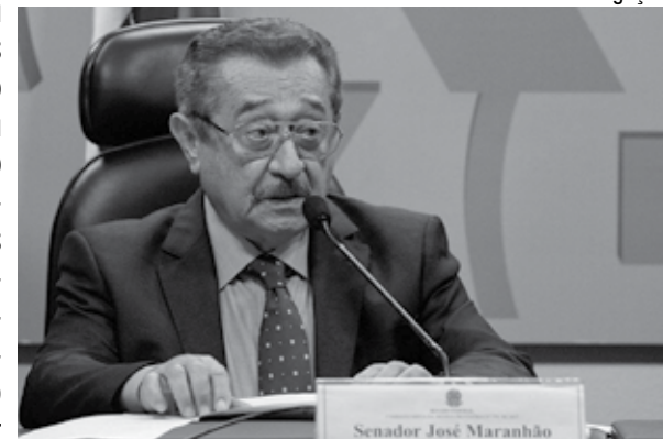
Senador José Maranhão